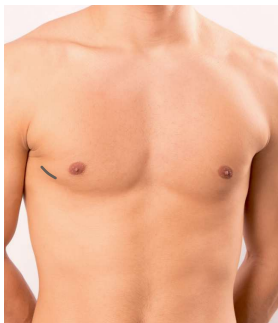
Chirurgie cardiaque mini-invasive